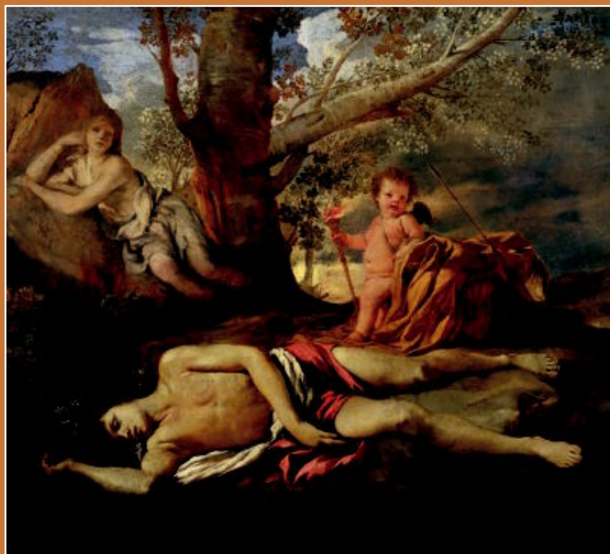
Никола Пусен (1594–1665), Ехо и Нарцис

Када се млада нимфа заљубила у Нарциса и када је уображеном младићу, који за њу није марио, желела да изјави љубав, није могла да изговори ниједну реч.